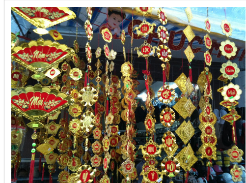
Cửa hàng bán dây lục lạc treo trang trí ngày Tết