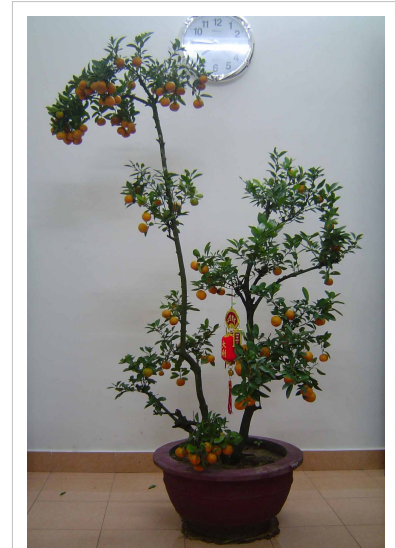
Cây quất đặt trong phòng khách.