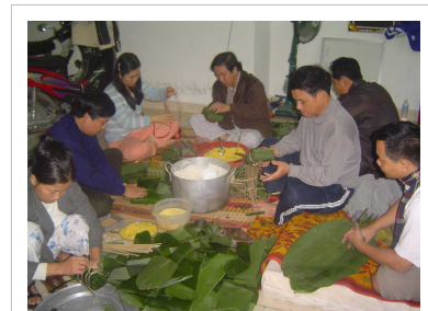
Một gia đình đang gói bánh chưng chuẩn bị cho ngày Tết Âm lịch.

Công việc sửa soạn cho ngày Tết của người Việt thường bắt đầu từ ngày 23 tháng Chạp, là ngày mà người Việt cúng ông Táo (Táo quân). Theo quan điểm của người Việt thì ông Táo vừa là thần bếp trong nhà vừa là người ghi chép tất cả những việc làm tốt xấu mà con người đã làm trong năm cũ và báo cáo với Ngọc Hoàng những vấn đề tốt xấu của gia chủ. Ông Táo được cúng vào trưa hoặc chiều ngày 23 tháng Chạp âm lịch hàng năm. Lễ cúng gồm có hương, nến, hoa quả, vàng mã và hai mũ đàn ông, một mũ đàn bà kèm theo ba con cá chép (cá chép thật hoặc cá chép làm bằng giấy kèm theo cỗ mũ). Theo sự tích ông Táo, cá chép sẽ đưa ông Táo vượt qua Vũ Môn để lên Thiên đình gặp Ngọc Hoàng. Một số gia đình ở nông thôn vẫn còn gìn giữ phong tục dựng cây nêu, trong khi ở thành phố, phong tục này đã bị lãng quên. Theo phong tục, cây nêu được dựng lên để chống lại quỷ dữ và những điềm gở. Cây nêu thường được treo hoặc trang trí thêm những thứ được coi là để dọa ma quỷ như: tỏi, xương rồng, hình nộm và lá dứa. Trước ngày Tết, người Việt cũng chuẩn bị bánh chưng, bánh giầy và các món ăn thịnh soạn để dâng lên ông bà tổ tiên.