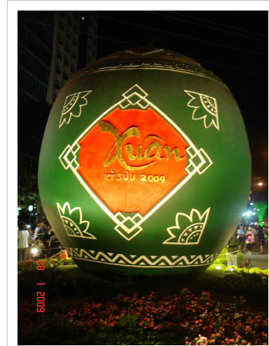
Trái dưa hấu khổng lồ tại Đường hoa Nguyễn Huệ 2009