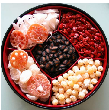
Hộp mứt và hạt dưa

Thành ngữ Việt Nam có câu Đói giỗ cha, no ba ngày Tết . Tết đến, dù nghèo khó đến đâu thì người ta cũng cố vay mượn, xoay xở để có đủ ăn trong ba ngày Tết sao cho "già được bát canh, trẻ có manh áo mới". Hơn thế nữa, dù có đói khát quanh năm thì đến Tết, mọi người mà nhất là trẻ em thường được ăn uống no đủ. Bữa ăn ngày Tết thường có nhiều món, đủ chất hơn và sang trọng hơn bữa ăn ngày thường. Vì vậy mà người ta cũng thường gọi là "ăn Tết". Ngoài cơm, ngày Tết còn có: