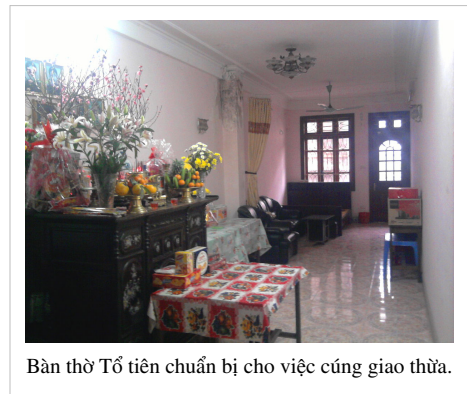
Bàn thờ Tổ tiên chuẩn bị cho việc cúng giao thừa.