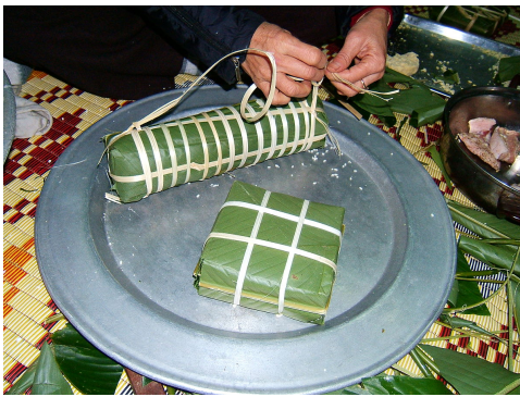
Một chiếc bánh chưng vuông và một chiếc bánh chưng tày vừa được gói