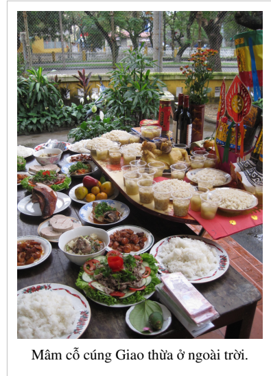
Mâm cỗ cúng Giao thừa ở ngoài trời.

Khi cúng Giao thừa trong nhà, các thành viên trong gia đình thường đứng trang nghiêm trước bàn thờ (không cần tất cả, chỉ cần gia chủ và vài ba người nữa) để khấn tổ tiên và xin được các cụ phù hộ độ trì trong nhà mới và cầu an khang thịnh vượng, sức khỏe tốt. Trước khi khấn Tổ tiên để mời tiền nhân về ăn Tết cùng với con cháu hậu thế, các gia chủ thường khấn thần Thổ Công để xin phép cho tổ tiên về ăn Tết. Ông là vị thần cai quản trong nhà (thường bàn thờ tổ tiên ở giữa, bàn thờ Thổ Công ở bên trái).