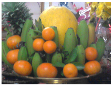
Một mâm Ngũ quả ngày Tết ở miền Bắc Việt Nam, gồm cam, quýt, bưởi, chuối và dứa.

Mâm ngũ quả là một mâm trái cây có chừng năm thứ trái cây khác nhau thường có trong ngày Tết Nguyên Đán của người Việt. Các loại trái cây bày lên thể hiện nguyện ước của gia chủ qua tên gọi, màu sắc và cách sắp xếp của chúng.