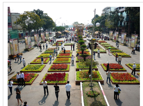
Một góc Đường hoa Nguyễn Huệ

Chợ Tết là những phiên chợ có phiên họp chợ vào trước tết từ 25 tháng Chạp cho đến 30 tháng Chạp, bán nhiều mặt hàng, nhưng nhiều nhất là các mặt hàng phục vụ cho tết Nguyên đán, như lá dong để gói bánh chưng, gạo nếp để gói bánh chưng hoặc nấu xôi, gà trống, các loại trái cây dùng thờ cúng (ngũ quả) để cúng tổ tiên,... Vì tất cả những người buôn bán hầu như sẽ nghỉ bán hàng trong những ngày Tết, những ngày đầu năm mới không họp chợ, nên phải mua để dùng cho đến khi họp chợ trở lại đưa đến mức cầu rất cao. Người Việt có câu mùng bốn chợ ma, mùng ba chợ người nên chợ được họp phiên đầu năm là mùng ba tết (ngày 3 tháng 1 âm lịch). Hơn nữa, chợ Tết cũng để thỏa mãn một số nhu cầu mua sắm để thưởng ngoạn, để lễ bái như hoa tết, những loại trái cây, đặc biệt là dưa hấu và những loại trái có tên đem lại may mắn như măng cầu, dưa, đu đủ, xoài,... Những loại chợ Tết đặc biệt cũng sẽ chấm dứt vào trước giờ Ngọ giao thừa. Vào những ngày này, các chợ sẽ bán suốt cả đêm, và