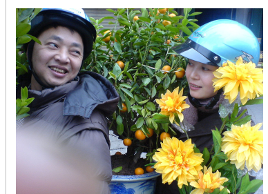
Niềm vui của người dân khi đã mua được một cây quất.

Ngoài hai loại hoa đặc trưng cho Tết là đào và mai, hầu như nhà nào cũng có thêm những loại hoa để thờ cúng và hoa trang trí. Hoa thờ cúng có thể như hoa vạn thọ, cúc, lay ơn, hoa huệ...; hoa để trang trí thì muôn màu sắc như hoa hồng, hoa thủy tiên, hoa lan, hoa thược dược, hoa violet, hoa đồng tiền... Ngoài ra, hoa hồng, cẩm chướng, loa kèn, huệ tây, lá măng, thạch thảo... cắm kèm sẽ tạo sự phong phú và mang ý nghĩa sum họp cho bình hoa ngày tết. Màu sắc tươi vui chủ đạo của bình hoa cũng ngụ ý cầu mong một năm mới làm ăn phát đạt, gia đình an khang và sung túc.