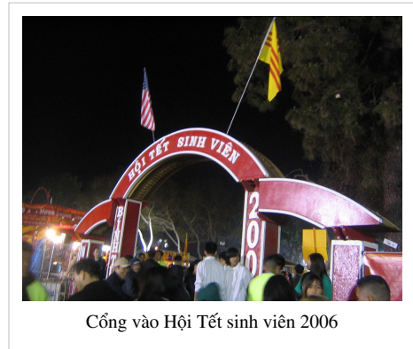
Cổng vào Hội Tết sinh viên 2006