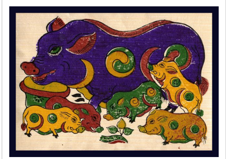
Tranh Đông Hồ trang trí ngày Tết Nguyên Đán

Tranh Tết từ lâu đã trở thành một tập quán, một thú chơi của người dân Việt Nam và không chỉ người có tiền mới chơi tranh mà người ít tiền cũng có thể chơi tranh. Nó là một phần không thể thiếu trong không gian của ngày Tết cổ truyền xưa kia. Những màu sắc rực rỡ như khơi gợi nên cảm giác mới mẻ ấm cúng rộn rã sắc xuân trong mỗi gia đình của người Việt.