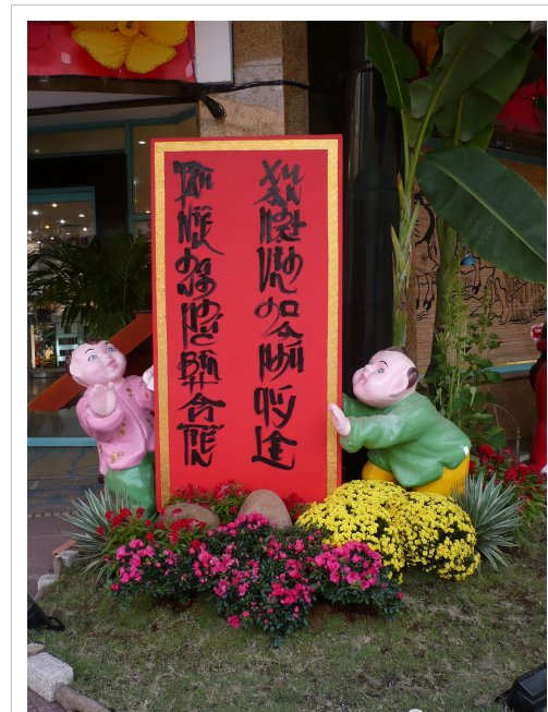
Một câu đối Tết tiếng Việt, viết theo lối thư pháp chữ Việt, tại Đường hoa Nguyễn Huệ 2009: "Tân niên hạnh phúc bình an tiến / Xuân nhật vinh hoa phú quý lai"

Mỗi năm hoa đào nở Lại thấy ông đồ già... (Vũ Đình Liên - Ông đồ) ...Đi đệt ngoài sân tràng pháo chuột Om thòm trên vách bức tranh gà (Tú Xương)