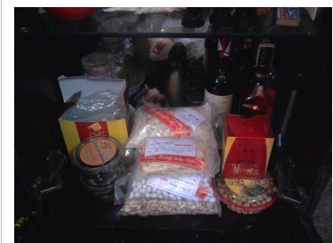
Các loại bánh mứt kẹo được dùng trong dịp Tết.