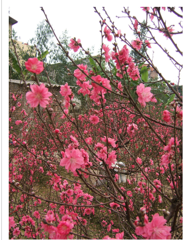
Hoa đào Nhật Tân trước đây

Miền Bắc thường chọn cành đào đỏ để cắm trên bàn thờ hoặc cây đào trang trí trong nhà, theo quan niệm người Trung Quốc, đào có quyền lực trừ ma và mọi xấu xa, màu đỏ chứa đựng sinh khí mạnh, màu đào đỏ thắm là lời cầu nguyện và chúc phúc đầu xuân.