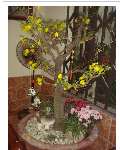
Hoa mai ngày Tết

Tết đến, cây quất thường được trang trí tại phòng khách. Cây quất Tết ngày càng có nhiều kiểu dáng cầu kỳ nhưng vẫn phải bảo đảm sự xum xuê, lá xanh tốt, quả vàng chi chít thể hiện sự trù phú, hứa hẹn năm mới được mùa, ăn nên làm ra, dồi dào sức sống.