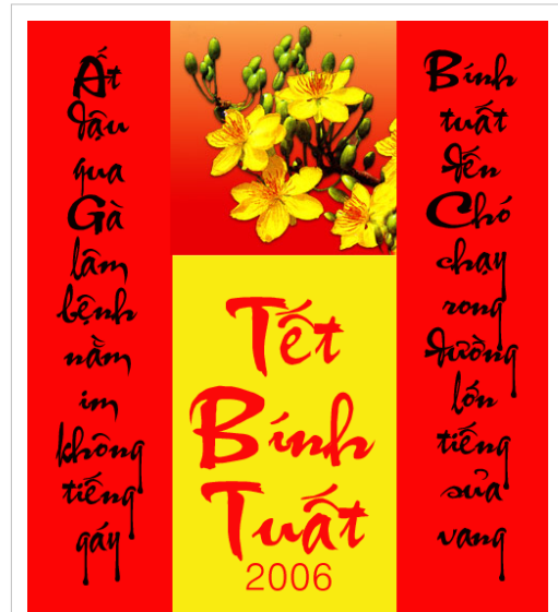
Câu đối Tết Bính Tuất (2006): 'Ất Dậu qua Gà lâm bệnh nằm im không tiếng gáy Bính Tuất đến Chó chạy rong đường lớn tiếng sủa vang'

Tết cũng là đề tài cho nhiều văn, thi sĩ: