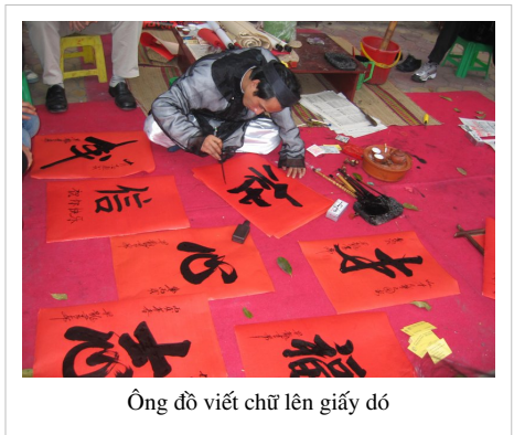
Ông đồ viết chữ lên giấy đỏ