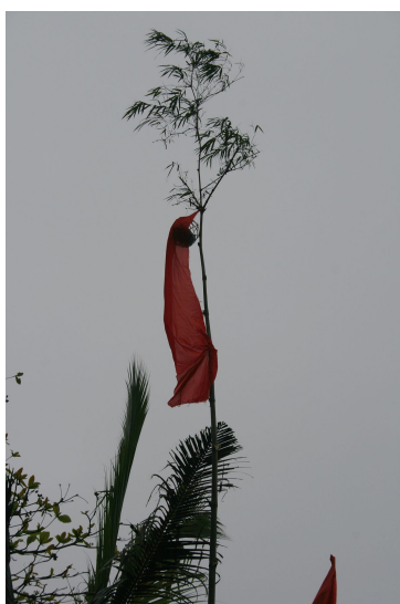
Cây nêu ngày Tết ở nông thôn Việt Nam, xuân Mậu Tý 2008.

Cây nêu là một cây tre cao khoảng 5–6 mét. Ở ngọn thường treo nhiều thứ (tùy theo từng địa phương) như vàng mã, bùa trừ tà, cành xương rồng, bầu rượu bện bằng rơm, hình cá chép bằng giấy (để táo quân dùng làm phương tiện về trời), giải cờ vải tây, điều (màu đỏ), đôi khi người ta còn cho treo lủng lẳng những chiếc khánh nhỏ bằng đất nung, mỗi khi gió thổi, những khánh đất va chạm nhau tại thành những tiếng kêu leng keng nghe rất vui tai... Ở Gia Định xưa, sách Gia Định Thành Thông Chí của Trịnh Hoài Đức, Tập Hạ chép rằng: " bữa trừ tịch (tức ngày cuối năm) mọi nhà ở trước cửa lớn đều dựng một cây tre, trên buộc cái giỏ bằng tre, trong giỏ đựng trầu cau vôi, ở bên giỏ có treo giấy vàng bạc, gọi là "lên nêu"... có ý nghĩa là để làm tiêu biểu cho năm mới mà tảo trừ những xấu xa trong năm cũ" .