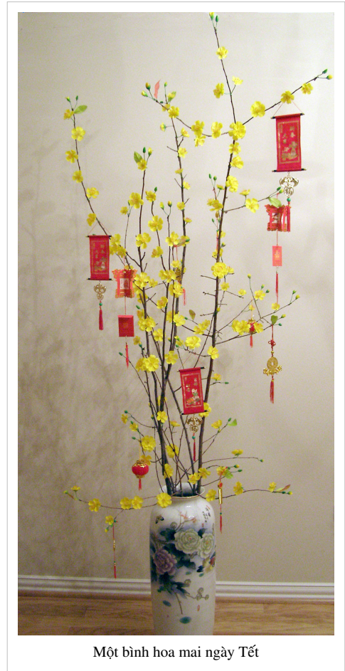
Một bình hoa mai ngày Tết

Người đi xông đất xong có niềm vui vì đã làm được việc phước, người được xông đất cũng sung sướng vì tin tưởng gia đạo mình sẽ may mắn trong suốt năm tới. Thời xưa, chỉ có hai cách chọn người tốt vía xông đất ngày đầu năm. Kẻ làm quan, người có học chọn người xông đất có tuổi hợp tuổi với chủ nhà.