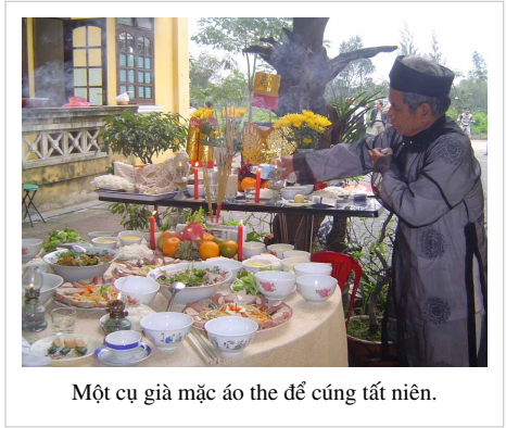
Một cụ già mặc áo the để cúng tất niên.

Sắp dọn bàn thờ Trong gia đình người Việt thường có một bàn thờ tổ tiên, ông bà (hay còn gọi ông Vải). Cách trang trí và sắp đặt bàn thờ khác nhau tùy theo từng nhà. Biền, bàn thờ là nơi tưởng nhớ, là thế giới thu nhỏ của người đã khuất. Hai cây đèn tượng trưng cho mặt trời, Mặt Trăng và hương là tinh tú. Hai bát hương để đối xứng. Phía sau hai cây đèn thường có hai cành hoa cúc giấy với nhiều bông nhỏ bao quanh bông lớn. Có nhà cũng cắm "cành vàng lá ngọc" (một thứ hàng mã) với sự cầu mong làm ăn được quả vàng, quả bạc và buôn bán lãi gấp nhiều lần năm trước. Ở giữa có trục "vũ trụ" là khúc trầm hương dưới dạng khúc khủy và vươn lên trong bát hương. Nhiều gia đình đặt xen hai cái đĩa giữa đèn và hương để đặt hoa quả lễ gọi là mâm ngũ quả (tùy mỗi miền có sự biến thiên các loại quả, nhưng mỗi loại quả đều có ý nghĩa của nó). Trước bát hương để một bát nước trong để coi như nước thiêng. Hai cây mía đặt ở hai bên bàn thờ là để các cụ chống gậy về với con cháu và dẫn linh hồn tổ tiên từ trên trời về hạ giới.